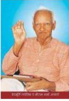
पुस्तकें, लेखन व वार्तालाप आचार्य

ज्यादा जानकारी यहाँ से प्राप्त करें : http://hindi.awgp.org/about_us